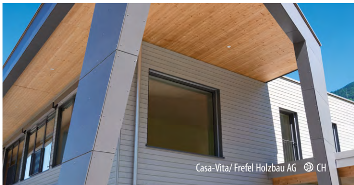
Casa-Vita/ Frefel Holzbau AG CH

Výrobce: AGROP NOVA a.s. Ptenský Dvorek 99 • 798 43 Ptení • Česká republika tel.: +420 582 397 852, +420 777 011 651 novatop-swp@agrop.cz • www.novatop-swp.cz